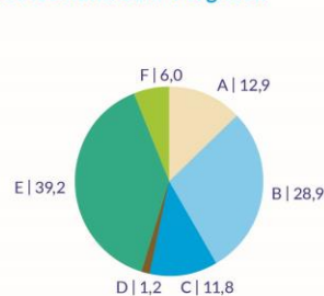
Deutschland zum Vergleich

Radioaktiver Abfall: 0,0003 g/kWh CO 2 -Emissionen: 350 g/kWh